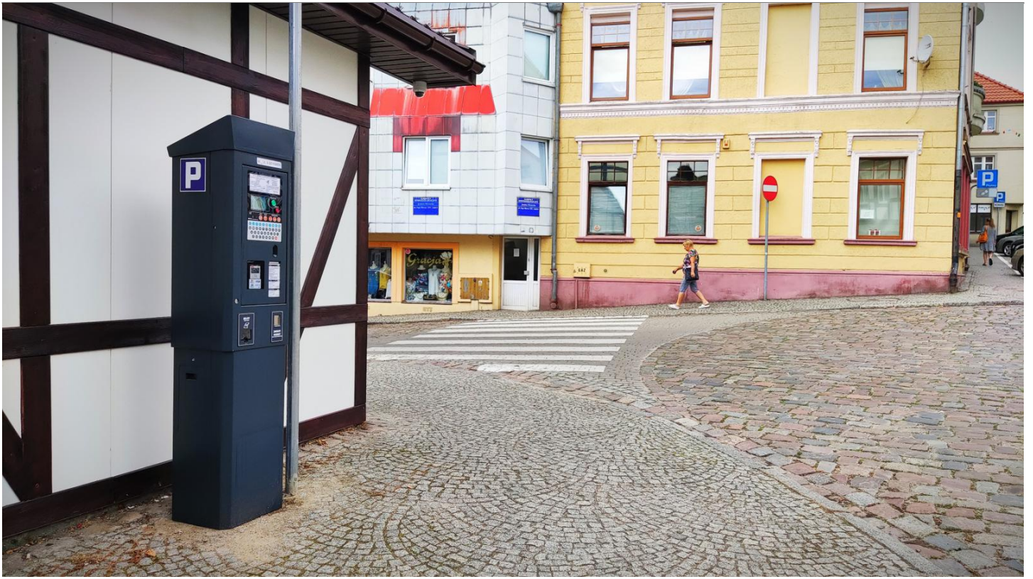
Ulica 5 Marca