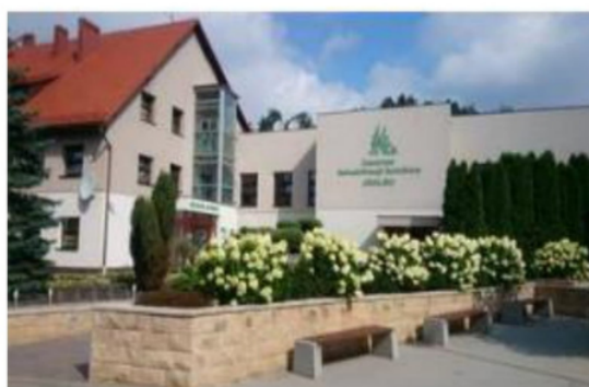
Centrum Rehabilitacji Rolników w Jedlcu