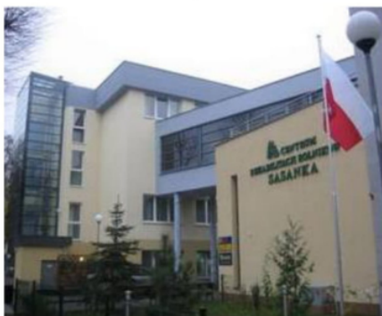
Centrum Rehabilitacji Rolników „Sasanka” w Świnoujściu