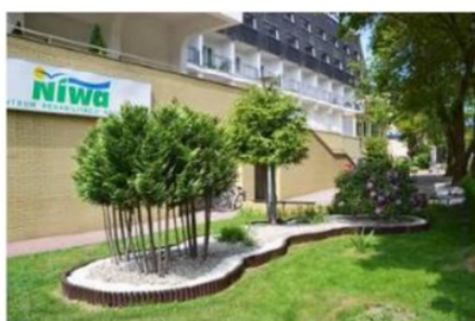
Centrum Rehabilitacji Rolników „Niwa” w Kołobrzegu