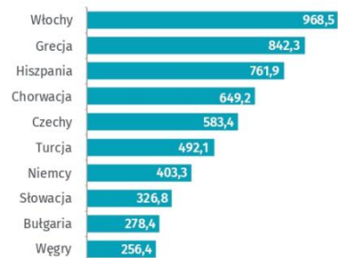
Wydatki mieszkańców Polski** związane z podróżami w 2023 r. w %