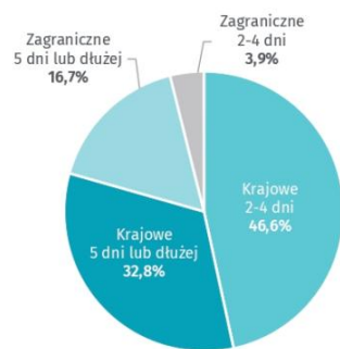
Podróże turystyczne mieszkańców Polski** według głównego celu w 2023 r. w %