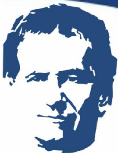
Św. Jan Bosko