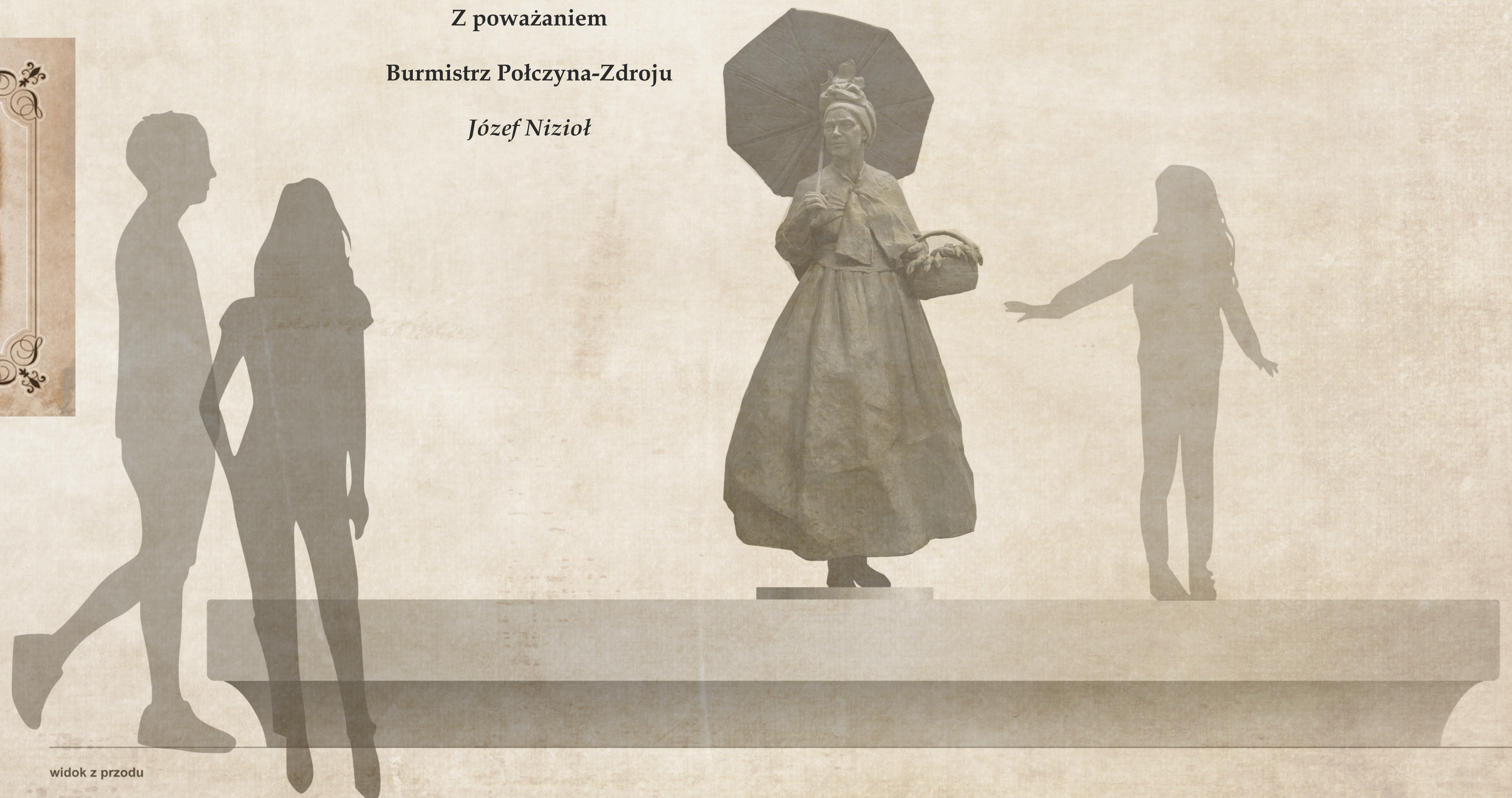
widok z przodu